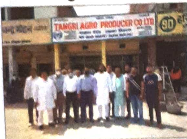
टांगरी एग्रो प्रोड्यूसर एफपीओ की टीम।