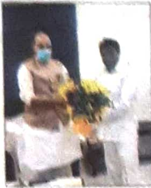
यहां दिल्ली में देश के रक्षा मंत्री राजनाथ सिंह से मुलाकात करते हरियाणा विधान सभा अध्यक्ष ज्ञान चंद गुप्ता।

पिंजौर (कुरुक्षेत्र)। जलवायु, 7 अप्रैल (कुरुक्षेत्र समाचार)। राष्ट्रीय सुरक्षा परिषद (एनएसए) के अध्यक्ष राजीव गांधी से सुरक्षा के क्षेत्र में विचार-विमर्श के दौरान एचएमटी के अध्यक्ष ज्ञानचंद गुप्ता ने पिंजौर स्थित एचएमटी की जमीन पर रक्षा विनिर्माण उद्योग स्थापित करने की मांग की। इस दौरान एनएसए और विचार-विमर्श के दौरान रक्षा विनिर्माण उद्योग और डिफेंस पार्क पर विस्तृत विचार-विमर्श हुआ है। गुप्ता ने केंद्रीय सचिव को बताया कि पिंजौर के सिरे चूने पर पंचकूला की पहचान को हैरिटेज और रक्षा उद्योगों के अंतर्गत करने के रूप में स्थापित होनी। इसके साथ ही रक्षा के क्षेत्र में भारत की आत्मनिर्भरता का अभाव भी दूर हो जाएगा। उन्होंने पिंजौर में प्रस्तावित रक्षा विनिर्माण उद्योग की