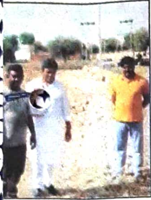
तथा इस समय वह फसल कटाई कार्य

ट्रेक्टरों की मदद में पाया आग पर काबू, सतनाली में दमकल केंद्र बनाने की मांग